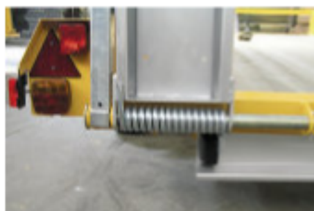
Rampas regulables en altura, asistidas por muelles

Atención: Para todo pedido, rogamos precise el tipo de anillo compatible con el enganche del camión (ver los esquemas).